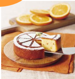
【ヨックモック】 オレンジのしっとりケーキ 1個 1,080円

アーモンドをたっぷり使って しっとり焼き上げた生地 にオレンジピールを 混ぜ込み、香り高く 仕上げました。 ※1日限定 14個