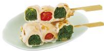
【鳥麻】 ささみ野菜巻き串(塩焼) 1本 230円

新鮮なブリコリーとミニトマトを 鶏ささみで巻いた旬の巻き串。 素材の味が引き立つ塩味でどうぞ。 ※1日限定 40本