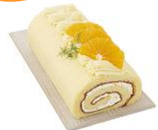
【テラ・セゾン】 季節瑞穂 セミノールオレンジ 1本 1,512円

芳醇な香りの赤肉メロンと爽やかな甘味の緑肉メロンをたっぷり使った季節限定ショートケーキ。 ※1日限定 20個