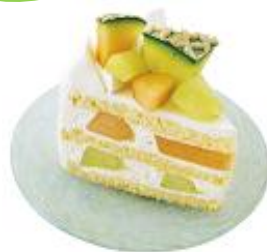
【柿の木坂 キャトル】 メロンショート 1個 480円

ぶどうゼリー、レモンゼリー、クラッシュゼリーの3層に、旬のさくらんぼを散りばめました。初夏にぴったりの爽やかなデザート。 ※1日限定 80個