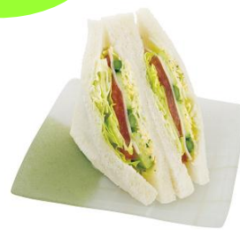
【サンドイッチハウス メルヘン】 ハムとグリーンサラダのサンド 1袋 388円

5種類の野菜を自家製のタルタルソースで 味付けした、初夏に嬉しいさっぱりとした サンドイッチです。