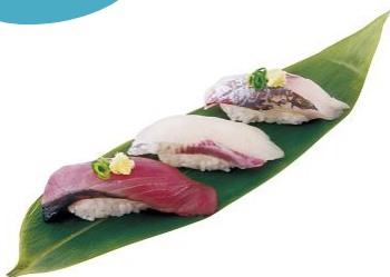
【立喰い寿司 築地魚がし日本一】 初夏の三貫王 1セット 432円

すっきりとした味わいの初がかつお。 程よい脂と旨みの鰹とヒラマサ。 江戸前の初夏を彩るにぎりを ご堪能ください。