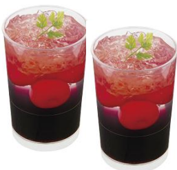
【京橋千疋屋】 さくらんぼと3層のグラスデザート 1個 648円

ぶどうゼリー、レモンゼリー、クラッシュゼリーの3層に、旬のさくらんぼを散りばめました。初夏にぴったりの爽やかなデザート。 ※1日限定 80個