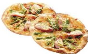
【アンデルセン】 アスパラとソーセージのピザ 1個 248円

アスパラとソーセージ、チーズを トッピングした“パン屋さんのピザ”。 バジルマヨソースがよく合います。