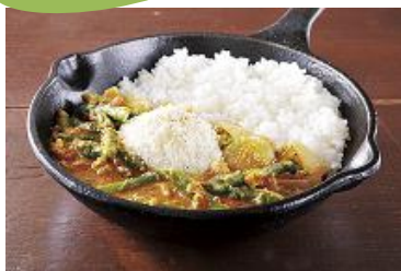
【野菜を食べるカレー キャンプ エクスプレス】 アスパラガスと半熟玉子のチーズカレー 1食 990円

この季節のcamp 定番メニュー！ 歯ごたえのよいアスパラをたっぷり入れて 半熟タマゴとチーズでまろやかに仕上げました。 ※提供時間:AM10:00~