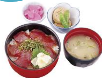
【品川 ひおき】 かつおのつけ丼定食 ポン酢仕立て 1セット 900円

身がしまっていてプリプリの食感が楽しめる かつおをたっぷり乗せた ひおき特製の丼をご賞味ください。 ※提供時間:AM11:00~