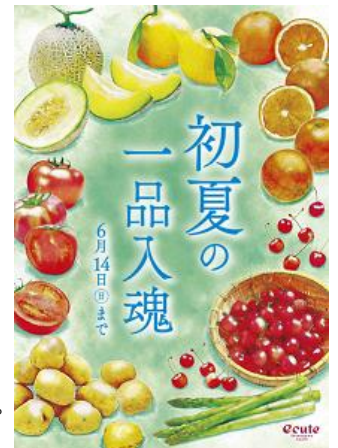
メインビジュアル

今回のキャンペーンでは、「初夏を楽しむ」をテーマに、「さくらんぼ」「トマト」「アスパラガス」「かつお」など、今が旬の食材を使用した各ショップの一品入魂アイテムをご用意しました。