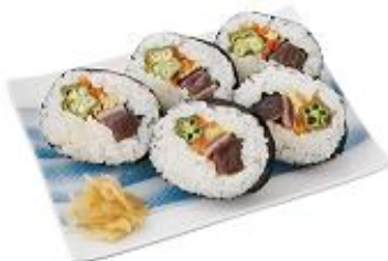
【加賀料理 大志満】 初がかつおの彩り巻き 5貫入 630円

初夏の味覚といえば初がかつお。 福井県産のコシヒカリと合わせて 食べやすい巻き寿司に仕上げました。 ※1日限定 10折