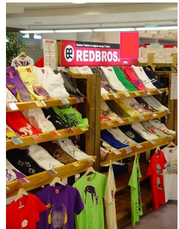
*写真は販売イメージです