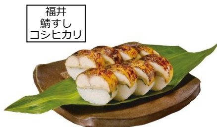
福井 鯖すし コシヒカリ