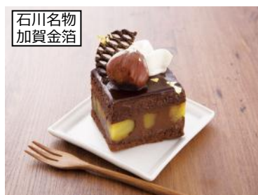
石川名物 加賀金箔

ひと口に「北陸」といっても、その魅力は語り尽くせません。まずはひと口、北陸を味わってみませんか。おいしさを通じて、一步踏み込んだ「北陸」の食や文化の魅力を発信します。