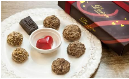
トリュフ&ハート 8 個入り