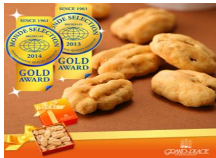
ペカンナッツ (キャラメル)

アーモンドクランチをチョコとホワイトチョコでコーティングし、ローストしたアーモンドをまぶした手作りの逸品です。