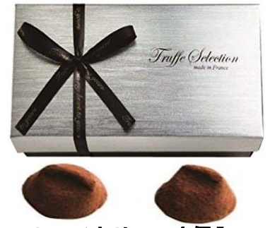
フレンチトリュフ 4 個入