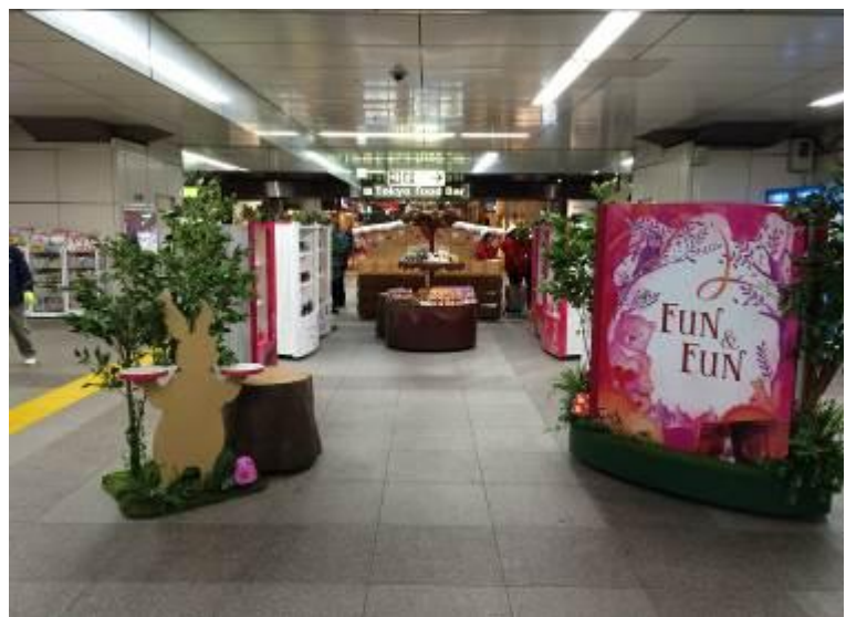
* 画像は販売イメージです