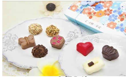
ショコラ 8 個入り

世界一に輝いたショコラトリーの熟練ショコラティエによる口どけなめらかな絶品トリュフがおすすめ。