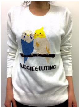
インコ柄ニット(4,900 円/税抜) プレミィ・コロミらしき満点の インコ柄インターシャニット。