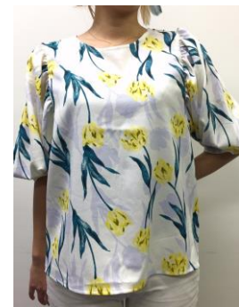
チューリップ柄ブラウス(4,900 円/税抜) 春らしいチューリップ柄は スカートもご用意しております。