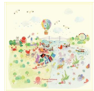
タオルハンカチ(660円/税抜) 肌触りのよい大人気のタオルハンカチ。 明石のお土産としてもおすすめです。