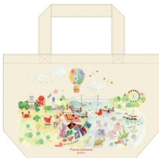
キャンバスバッグ(1,600円/税抜) ランチトートとしてお使いいただける サイズ感の丁度よいキャンバスバッグです。

明石オリジナル限定デザインは、地元のお客様にも親しんでいただけるよう 明石焼きや魚の棚などの明石の魅力を沢山詰め込んだデザインと、日本の標準時刻を刻む 可愛い花時計柄の2種類です。 キャンバスバッグや巾着、スライドミラーなど 10種類以上もの商品をご用意しております。 観光に来られた方には、お土産としてもおすすめです。