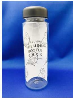
ウォーターボトル(1,600 円/税抜) ペットボトルの様に軽いのに 温かいものにも使えます。