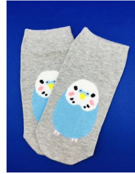
スニーカーソックス(500 円/税抜) ありそうでなかったインコ柄の スニーカーソックス。日本製。