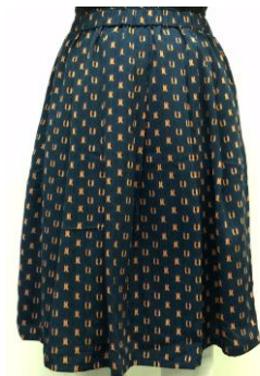
ペンギン柄スカート(6,900 円/税抜) プレミィ・コロミで人気の アニマル柄シリーズ。