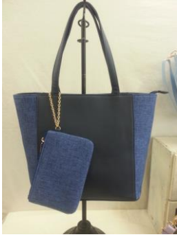
ポーチ付 A4 トート(4,900 円/税抜) A4 サイズがはいる綺麗な トート。ポーチには定期やリップを入れて。