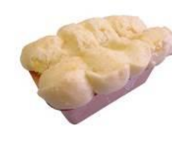
ミニスターブレッド・チーズ（新潟県） 580円（税込）

冷やして食べるスイーツパン。クリームやパン生地は全て毎日手作り。今なお愛され続けている絶品くりむパンです。