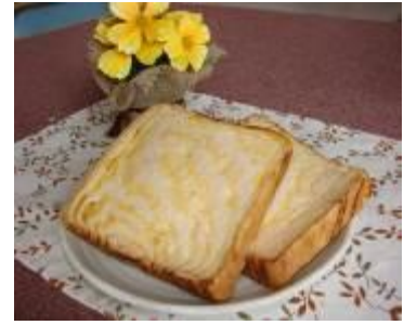
みかん食パン（愛媛県） 800円（税込）

宮古島からやって来た島パン。バニラ風のクリームがふんだんに入っており、ご当地土産として、人気となっています。