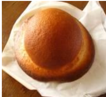
ぼうしパン（高知県） 250円（税込）

林檎と苺のジャムの甘酸っぱさのアクセントが丁度よく、また、パン生地だけでも満足感のある一品です。