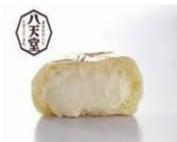
八天堂（広島県） 210円（税込）

冷やして食べるスイーツパン。クリームやパン生地は全て毎日手作り。今なお愛され続けている絶品くりむパンです。