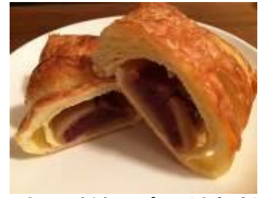
京八つ橋あんぱん（京都府） 220円（税込）

年間50万本売れるヒット商品。長さ約18cmと大きめですが、あっという間に食べきれぬ大きさです。