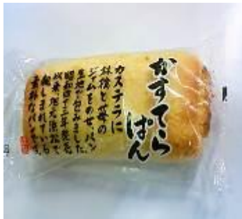
かすてらパン（静岡県） 350円（税込）

国産温州みかんで作った独自配合のみかんペーストを練り込んだみかんパン。そのまま食べてもおいしいです。