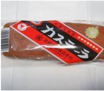
ビタミンカステラ（北海道） 180円（税込）

卵と砂糖をたっぷりを使用し、「安くて栄養価の高い」カステラです。もうすぐ100年の旭川のソウルおやつです。