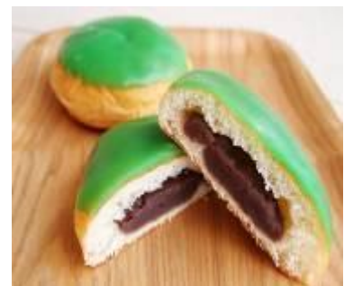
ヒスイパン（富山県） 250円（税込）

高知県では誰もが知っているパン。カステラのサクサク感とコッペパンのふわふわ感が一体となったパンです。