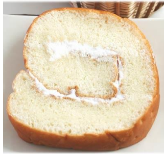
うずまきパン（沖縄県） 260円（税込）

卵と砂糖をたっぷりを使用し、「安くて栄養価の高い」カステラです。もうすぐ100年の旭川のソウルおやつです。