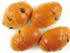
<商品名> Panest レーズンロール

■クロワッサンやロールパンなど定番商品で多くのお客さまに選んでいただける品揃えに！ ■全商品 108 円（税込）で手に取りやすいお手頃価格！ ■4 個入りで、好きなタイミングで分けて食べられる！（再封シール添付） ■5 月 31 日発売