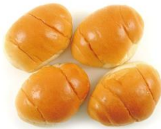
<商品名> Panest しっとりロール