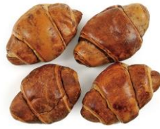
<商品名> Panest ミニクロワッサンチョコ