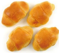
<商品名> Panest ミニクロワッサンクリーム

<食卓パン> Panest から初の食卓パンをが 5 品発売になります。選ぶ楽しさが広がります！