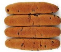
<商品名> Panest スナックパンチョコ