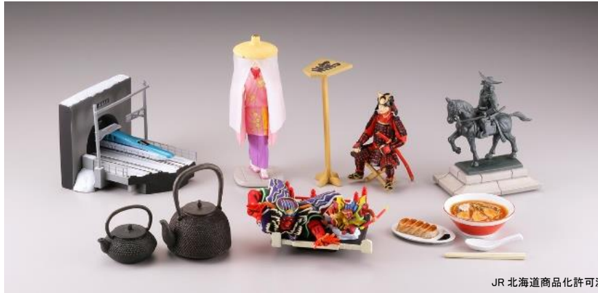
JR 北海道商品化許可済

東北六魂祭 2016 青森の応援企画として、6月11日(土)より首都圏のNewDays・BOOK EXPRESSで販売いたします。 ■公式サイト: http://www.rokkon.jp/