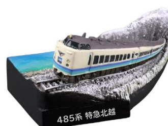
日本海をバックに走る特急北越

屈指の撮影ポイントである新桂川橋梁(通称:鳥沢鉄橋)は、中央本線最長の橋梁。「伝統の継承」「未来への躍動」をデザインコンセプトに、2015年(平成27年)7月25日に出場した新型車輛「E353系量産先行車」との情景をフィギュア化。