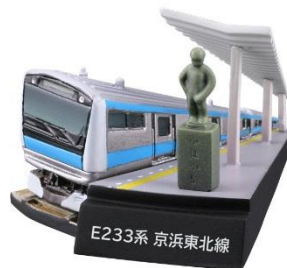
小便小僧と京浜東北線

新幹線や通勤電車、特急列車に加え新型車輛から懐かしの名車まで幅広いラインナップを揃えた JR 東日本鉄道フィギュアです。