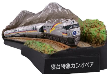
安達太良山をバックに走る寝台特急カシオペア

1997年(平成9年)、全車両2階建て、且つ全客室がA寝台個室で編成される豪華列車としてデビューした寝台特急カシオペア。今回は安達太良山を背景にフィギュア化。撮影スポット最寄りの金谷川駅の「金谷川」は、旧・金谷川村創設時に金沢村、関谷村、浅川村から一文字ずつ取って作られたのが由来。