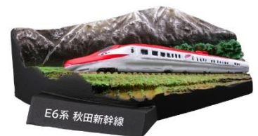
岩手山をバックに走る秋田新幹線こまち

1952年(昭和27年)10月14日、鉄道開通80周年に際し建てられた小便小僧。浜松町駅 3・4 番線ホームにあり、季節によって衣装を変え、利用客の目を楽しませている。今回は、京浜東北線「E233 系」との情景を再現。