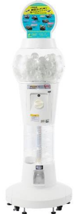
カプセル自販機(イメージ)

ラッキードロップの新シリーズとして多数お問合せをいただいております「JR東日本鉄道コレクション」は、駅構内に設置されるカプセル自販機他、NewDays・BOOK EXPRESSなどのエキナカ店舗でもお買い求めいただけます。旅の記念や親しい方へのお土産に、是非ご利用ください。