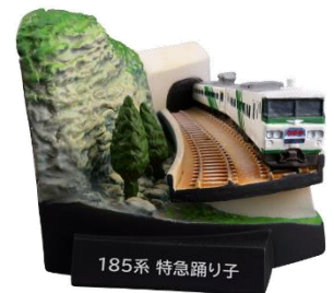
石橋山トンネルと特急踊り子

有名撮影スポットが点在する鯨波駅と青海川駅の間には、一年を通して沢山の鉄道ファンが訪れる。今回は日本海を背景に、北陸新幹線の開業で惜しまれながら廃止となった特急北越をJR東日本新潟支社が独自に塗装した通称「新潟色」でフィギュア化。