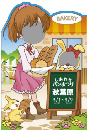
▲秋葉原バージョン

JR秋葉原駅・JR池袋駅・JR東京駅の各駅で、 人気の顔出しパネルを設置します！