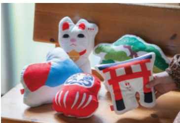
ニッポンクッション S 各 1,296 円 (税込)