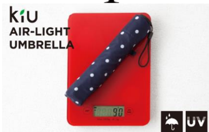
エアライトアンブレラ 3,240 円 (税込)

日常生活の中での、天気によって変わるライフスタイルを 様々な世代とジャンルにミックスできるスタイリングアイテムをご提案します。