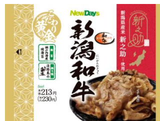
＜パッケージイメージ＞