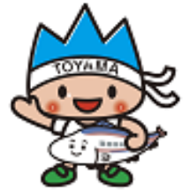
〈富山県『きとときと君』〉

〈日時〉 3月21日(土) ・①10:00~/②11:00~ 福井県『ラプト(ジュラチック)』 3月22日(日) ・①10:00~/②11:00~ 石川県『ひやくまんさん』 ・①16:00~/②17:00~ 富山県『きとときと君』