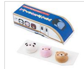
「プレミアムどうぶつえん 北陸新幹線開通記念パッケージ」 浪越軒