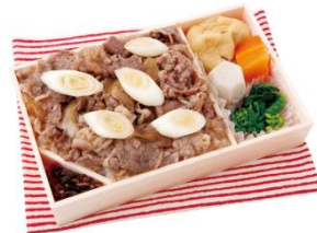
「能登牛すきやき」 加賀料理 大志満