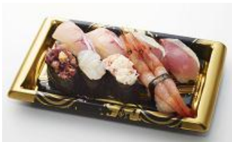
「北陸握り」 魚力海鮮寿司

北陸の素材を使った食や雑貨、北陸新幹線にちなんだグッズが盛りだくさん。五感で北陸の魅力に触れられます。