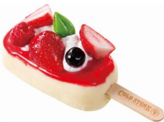
ストロベリーショートケーキ 480円（税込）