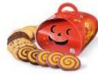
ジャンボパンプキン