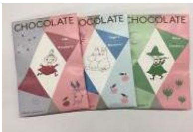
ベリーチョコレート