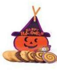
ミスターパンプキン