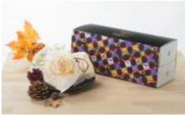
八天堂くりーむパン