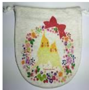
リース親子オカメインコ 巾着 1,404 円