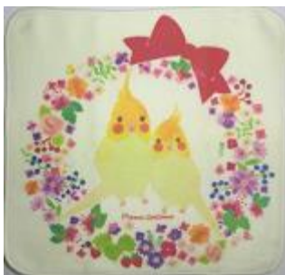
リース親子オカメインコ ハンカチ 712 円