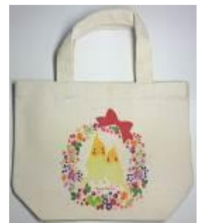
リース親子オカメインコ トートバック 1,728 円