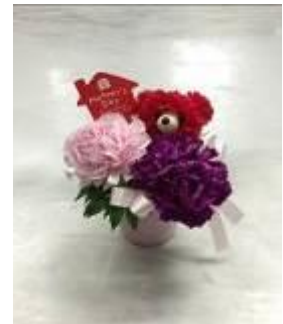
生花アレンジメント 1,500 円