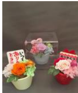
プリザーブドフラワーアレンジ 1,815 円