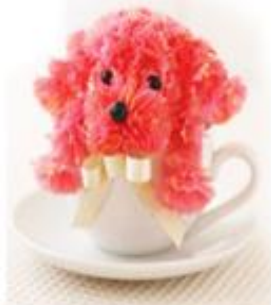
プードルアートフラワー 2,000 円