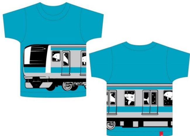
※秋葉原駅FUN&FUN限定デザインTシャツ