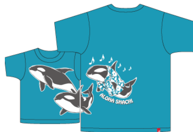
※つながるデザイン イメージ2