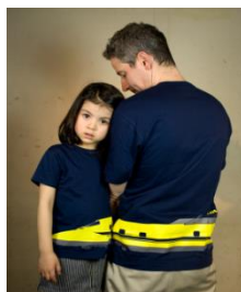
※つながるデザイン イメージ1