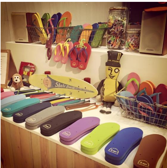
※オリジナルビーチサンダル（B-san）