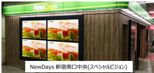
NewDays 新宿南口中央(スペシャルビジョン)