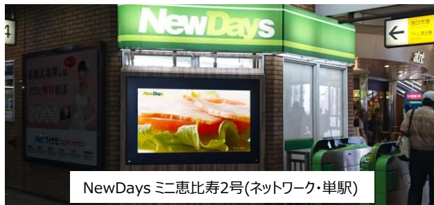
NewDays ミニ恵比寿2号(ネットワーク・単駅)