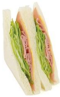
シャキシャキレタスサンド 247円(税込)

食感にこだわったシャキシャキのレタスと、2種類のハム、チーズをすりおろし野菜ソースで味付けしたサンドイッチです。