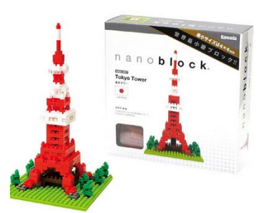
ナノブロック 東京タワー 1,998 円 (税込)