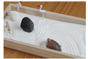
ミニ枯山水キット 2,365 円 (税込)