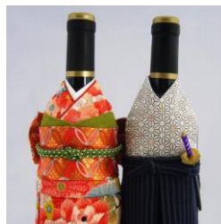
着物ボトルウェア 左: 3,240 円 (税込) 右: 2,592 円 (税込)