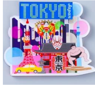
ジャパノラマ マグネット 540 円 (税込)