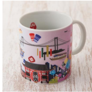
ジャパノラマ マグカップ 1,296 円 (税込)