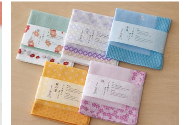
吉祥ハンカチ 各 648 円 (税込)