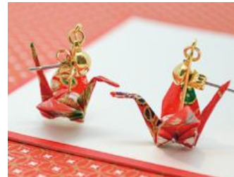
折紙ピアス 1,296 円 (税込)