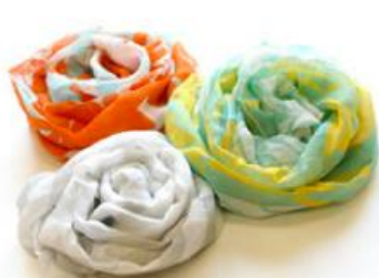
麻ストール 各 2,160 円 (税込) ★UV カット機能付