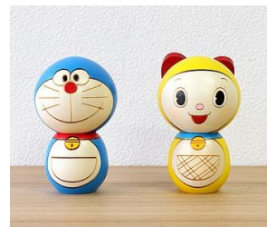
創作こけし ドラえもん 各 4,320 円 (税込) ★群馬県こけし工場の 「卯三郎こけし」