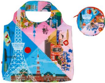
ジャパノラマ 旅友エコバッグ 1,296 円 (税込)