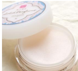
練り香水 1,080 円 (税込) ★美容成分シアバター配合