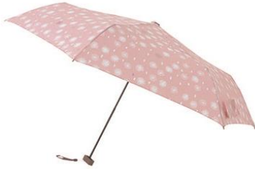
mabu × ことりっぷ フラット折りたたみ傘 2,268 円 (税込)

「ありふれた日常にちょっといいコト」をテーマに、 雨がもっと好きになる、機能性とデザインを兼ね備えたアイテムをご提案します。