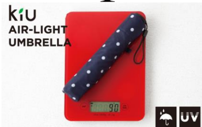
エアライトアンブレラ 3,240 円 (税込)

日常生活の中での、天気によって変わるライフスタイルを 様々な世代とジャンルにミックスできるスタイリングアイテムをご提案します。