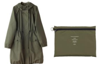
モッズレインコート 5,184 円 (税込)

★カラー：ブラック・ブラウン サイズ：S (23-23.5cm) M (23.5-24cm) L (24-24.5cm)