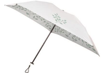
晴雨兼用折りたたみ傘 ヒートカットライト 3,780 円 (税込)