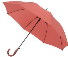
耐風骨ジャンプ傘 ストーム 2,376 円 (税込)