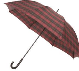
リフレクター アンブレラ 7,560 円 (税込)