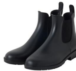
レインブーツ 3,996 円 (税込)

★カラー：ブラック・ブラウン サイズ：S (23-23.5cm) M (23.5-24cm) L (24-24.5cm)