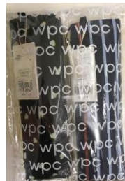
日傘 2 本入り福袋 2,500 円 (税込)