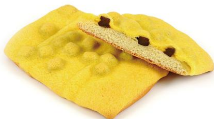
Panest バナナチョコづくし 8月1日発売 134円（税込）

【販売箇所】 首都圏・長野・新潟・東北の NewDays・KIOSK にて販売（一部店舗除く）