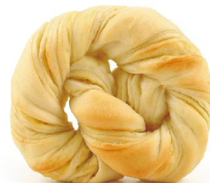
Panest もちっとバナナ 8月1日発売 123円（税込）

ふんわり食感のパンケーキにバナナクリームとミルクホイップクリームをサンドしました。デザートとしても最適な1品です。