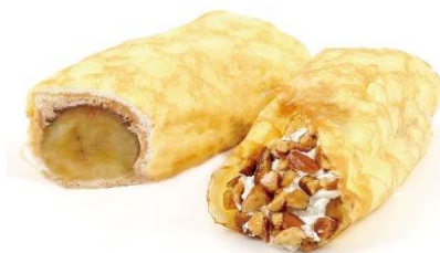
EKI na CAFE 大きなチョコバナナクレープ 8月1日発売 268円（税込）

もちっとした食感の生地にはバナナ入りクリームを折りこみ、焼き上げました。手軽に食べられるバナナの香りが続く1品です。