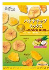
バナナチップミックス 発売中 198円（税込）

バナナをまるごと1本包んだ贅沢なチョコバナナクレープ。食感豊かなナッツと、バナナの味を引き立たせるビターチョコソースを合わせました。