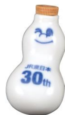
JR東日本発足30周年 記念ひょうちゃん