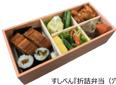
すしべん『折詰弁当（穴子鮓）』