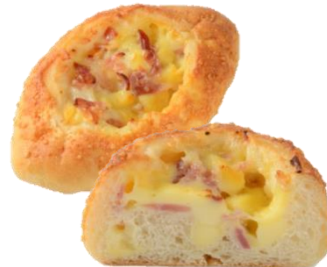
HOKUO『おしょうゆチーズフランス』