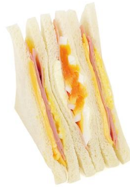
ハムチーズたまごサンド 260円(税込)

こだわりのたまごサラダの層と、シーザーサラダソースで仕立てた彩りの良いハムサラダの層、そしてツナの層はツナ比率を上げて具材感をアップしたツナサラダに玉ねぎの食感が楽しめます。 ※首都圏・長野・東北エリアで販売(一部店舗除く)