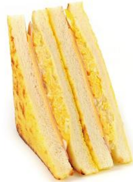
フレンチトーストサンド(ハムチーズ) 260円(税込)

ヘルシー志向のお客さまにアプローチした野菜をたっぷり摂れるサンドです。真ん中の層にはサラダチキンはさみ、満足感のある一品に仕上げました。 ※首都圏・長野・東北エリアで販売(一部店舗除く)