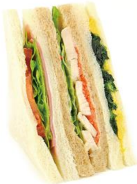
たっぷり野菜のミックスサンド (レタス・サラダチキン・たまご) 330円(税込)

人気具材のハムとチーズと、具材感やコクがアップしたこだわりのたまごサラダをはさみました。しっとり・ふわふわのパンが具材を際立たせます。 ※首都圏・長野エリアで販売(一部店舗除く)