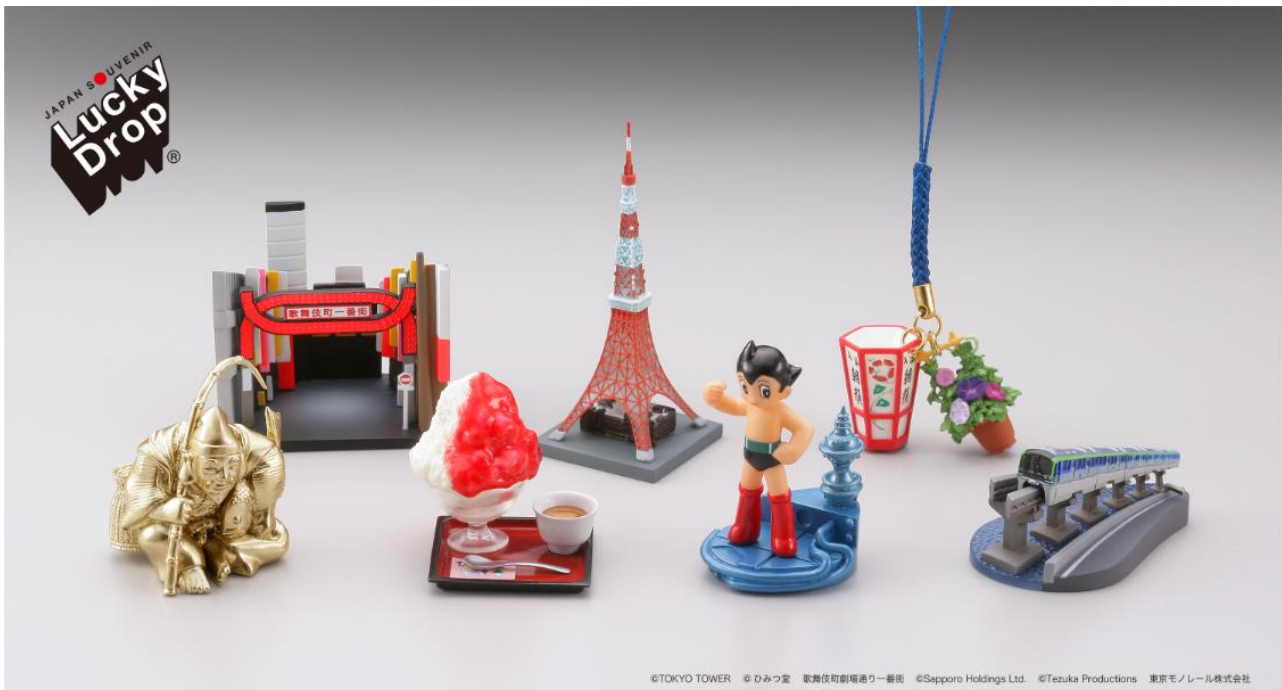
©TOKYO TOWER ©ひみつ堂 歌舞伎町劇場通り一番街 ©Sapporo Holdings Ltd. ©Tezuka Productions 東京モノレール株式会社

前列左から：恵比寿様／ひみつ堂 ひみつのいちごみるく©ひみつ堂／鉄腕アトム ©Tezuka Productions／東京モノレール 10000 形車両 東京モノレール株式会社 後列左から：歌舞伎町一番街 歌舞伎町劇場通り一番街／東京タワー©TOKYO TOWER／入谷朝顔市