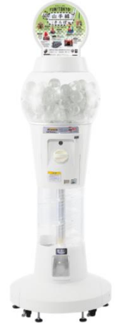
カプセル自販機 (イメージ)