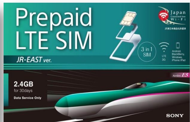
◆プラン 2.4GB(E5 系)