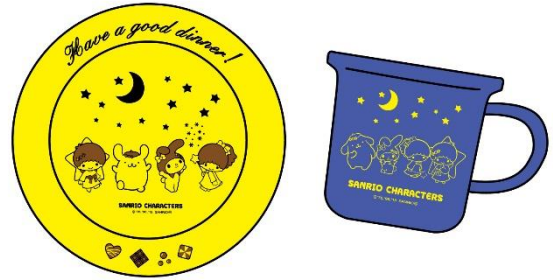
夜 Good dinnerセット (ディナー皿・マグカップ) 100名様