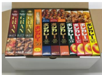
ボンカレー詰め合わせセット 30名さま

10月9日(火)から10月22日(月)の期間中、NewDays 公式 Twitter アカウント「NewDays (@newdays_jp)」をフォローし、対象のキャンペーン告知ツイートをリツイートしていただくと、抽選で「ボンカレー詰め合わせセット」を30名さま、「ボンカレーオリジナルTシャツ」を20名さまにプレゼントします。