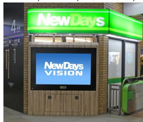
NewDays大型ビジョン(113駅 212台設置)