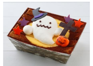
黄栗のハロウィンティラミス 1個 1,728円(税込) シーキューブ(エキュート品川/大宮) 黄栗を使用した、秋らしい味わいとマスカルポーネの組み合わせがベストマッチ。ハロウィン限定のティラミスです。 ※販売期間:~10月31日 ※エキュート品川はイベントスペース「プレミアムセレクト」にて展開