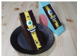
旬の果実のシフォンサンド パンプキン 1個 600円(税込) オーヴォ(エキュート大宮) 紫芋のシフォン生地、チョコチップを混ぜ込んだパンプキンクリームをサンドした、見た目も楽しいシフォンサンドです。 ※販売期間:~10月31日 ※エキュート大宮限定