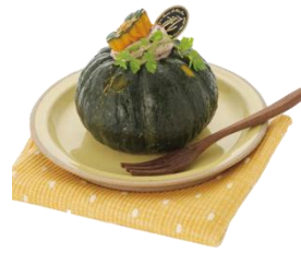
魔法のかぼちゃ 1個 540円(税込) イルフェジュール (エキュート立川) 坊ちゃんかぼちゃをまるごと使ったかぼちゃプリン。皮ごとすべて食べられる季節限定商品です。 ※販売期間:無くなり次第終了