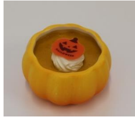
かぼちゃプリン 1個 530円(税込) パティスリー-QBG(エキュート品川) しっとりなめらか、はちみつとかぼちゃの優しい甘みがびったりな商品です。 ※販売期間:~10月31日