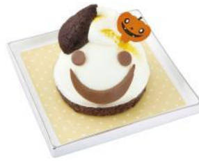
キャスパー 1個 500円(税込) 柿の木坂 キャトル (エキュート品川 サウス/京葉ストリート/上野) レアチーズの中にかぼちゃのプリュレが入ったハロウィン限定の可愛らしいおばけケーキです。 ※販売期間:~10月31日