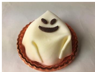
ファントム 1個 648円(税込) ダロワイヨ(エキュート品川/立川/日暮里) ハロウィンのおばけをイメージしたキュートなケーキ。フランボワーズとフレーズのコンポートとチーズムースの組合せ。 ※販売期間:~10月31日