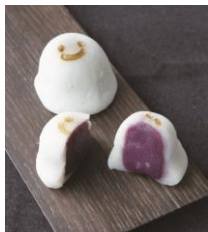
おばけ餅 1個 216円(税込) 菓匠 禄兵衛 (エキュート東京) ふわふわの滋賀羽二重餅で濃厚な紅芋あんと食感のよいクルミを包みこんだハロウィン限定のかわいらしい大福です。 ※販売期間:10月19日~10月31日