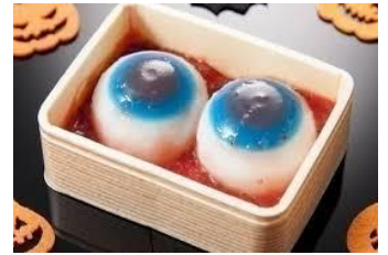
目玉の水まんじゅう 1個 540円(税込) 菓子匠 末広庵(エキュート品川) 目玉を表現した「水まんじゅう」を苺のソースで作った血の海に浮かべました。素朴な味わいが特徴のハロウィン限定和菓子です。 ※販売期間:~10月31日 ※イベントスペース「プレミアムセレクト」にて展開