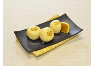
ハロウィン饅頭 1個 180円(税込) 深川伊勢屋 (エキュート日暮里) 旬のかぼちゃを使ったかぼちゃあん。おバケの顔の焼印が可愛らしい人気のお饅頭です。 ※販売期間:~10月31日