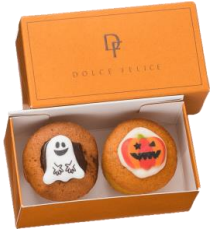
プティパウンド ハロウィン 1箱 600円(税込) ドルチェフェリーチェ (エキュート上野) かぼちゃと紫いものパウンドケーキにジャックとゴーストの可愛い砂糖菓子をトッピングしました。 ※販売期間:~10月31日