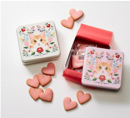
▲茶白猫さんのクッキー缶 (池袋会場)

今回は、みんな大好き！動物ギフトとして、会場毎に、クマやネコ、ペンギンやパンダをモチーフにしたスイーツを販売いたします。