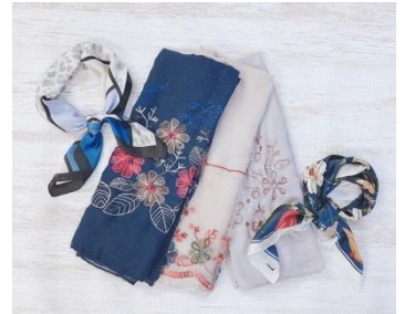
ストール/スカーフ 各1,080円(税込)

今年大人気のスカーフやこれからの季節にマストアイテムのストールが全て1,080円！人気の刺繍やオーガンジーなど、豊富な種類を取り揃えておりますので、是非お気に入りの一枚をみつけてみてはいかがでしょうか。