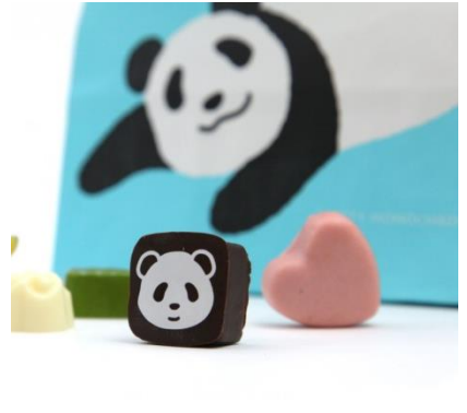
▲ぱ・ぱ・ぱ・ぱんだ (上野会場)