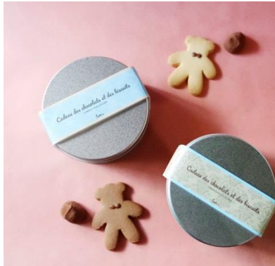
▲ガトー デ ショコラ エ デ ビスキュイ (池袋会場)