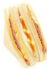
ハムチーズ たまごサンド 260円(税込)