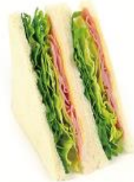
シャキシャキ ダブルレタスサンド 257円(税込)