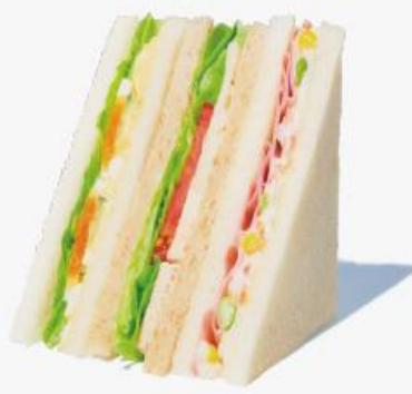
たっぷり野菜のミックスサンド