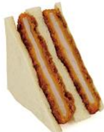
三元豚のこだわり ロースカツサンド 360円(税込)