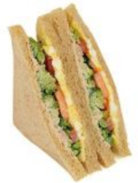
189kcal ツナとトマトの ごろごろ野菜サンド 298円(税込)