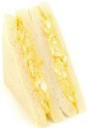
たっぷりたまごサンド 220円(税込)

柔らかくジューシーな唐揚げとたまごを組み合わせせたサンドイッチです。シンプルな醤油の味付けをしたボリュームのある唐揚げは、さらにおいしくなったたまごサラダと相性抜群です。 ※首都圏・長野・新潟・東北エリアで販売(一部店舗除く)