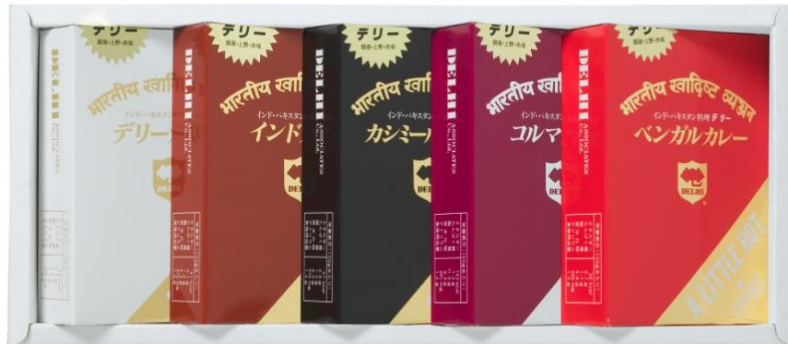
『カレーオールスター』